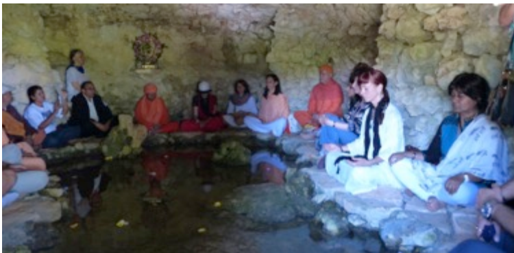
Meditação na Gruta