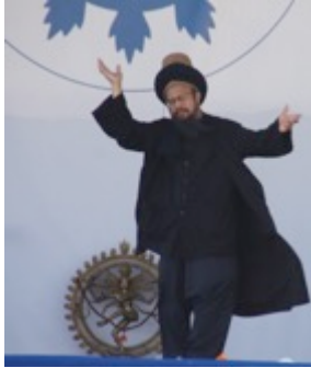
Apresentação pela Ordem Sufi Naqshbandi