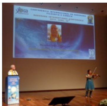
Reverend Patrick McCollum USA