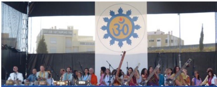
Apresentação de Mantra / Kirtana pelo Coral Orquestra OMKÁRA da Confederação Portuguesa do Yoga