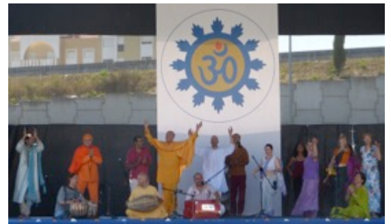
Apresentação de Kirtana pela ISKCON / Hare Krishna