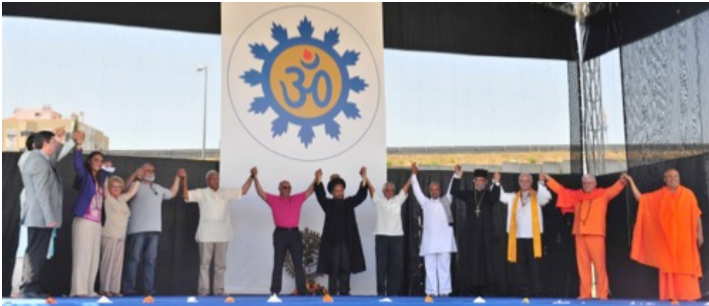
AS PRINCIPAIS RELIGIÕES, E FILOSOFIAS, DO MUNDO EM PALCO – E OS SEUS PODEROSOS VOTOS