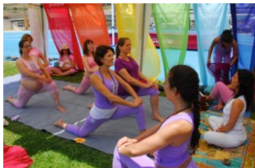
Aula do Yoga para Gestantes