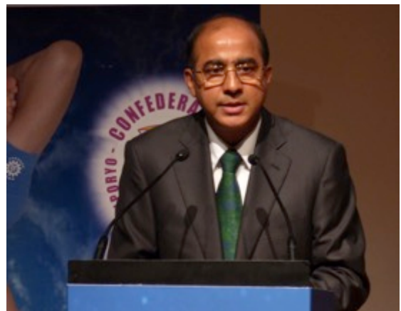
A valorosa intervenção de Sua Excelência o SR. EMBAIXADOR DA ÍNDIA EM PORTUGAL