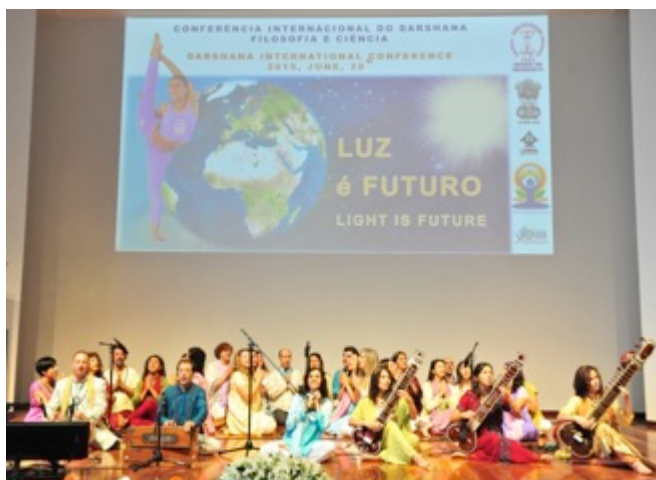
O OMKÁRA na abertura do Dia do Darshana

Como é habitual, no Dia anterior – Sábado (20 de Junho) - a partir das 9:00h, na Fundação Champalimaud, teve lugar a formidável sessão de conferências, onde grandes Filósofos, Sábios, e Cientistas, discursaram durante todo o dia.