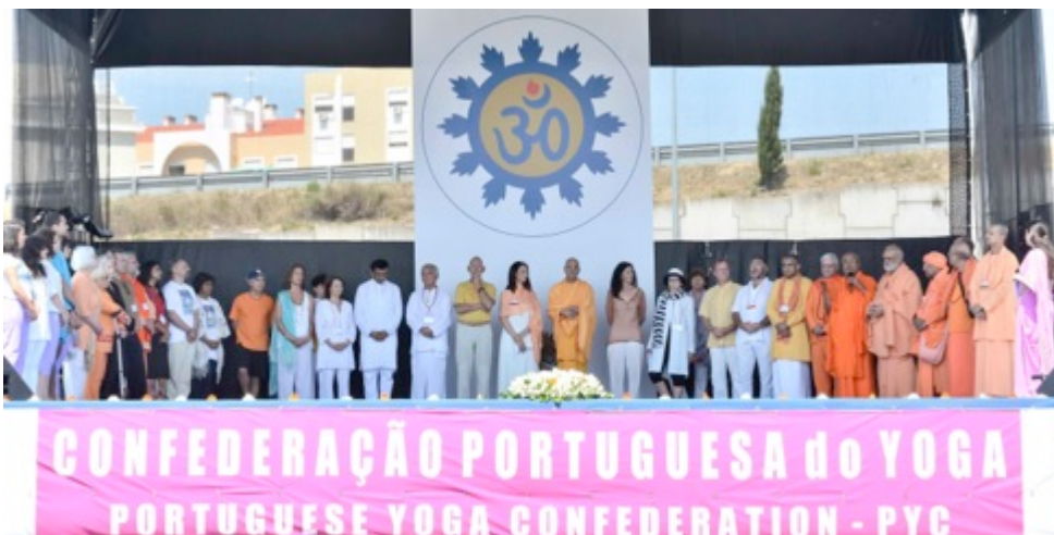
TODAS AS ESCOLAS DO YOGA EM PALCO – ÍNDIA, AMÉRICAS, EUROPA COM PORTUGAL INCLUÍDO