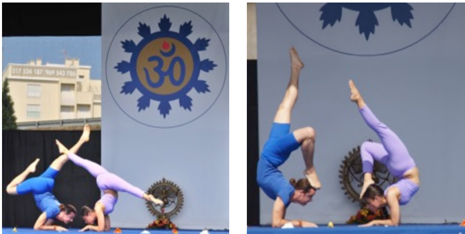
Demonstração do Yoga Tradicional Avançado pelo PASHUPATI

A Abertura do Dia Internacional do Yoga foi marcada pela Beleza da Demonstração do Yoga Tradicional Avançado de Par, pelo PASHUPATI – Demonstradores do Yoga Tradicional Avançado da Confederação Portuguesa do Yoga.