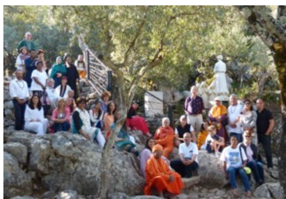
Loca do Anjo