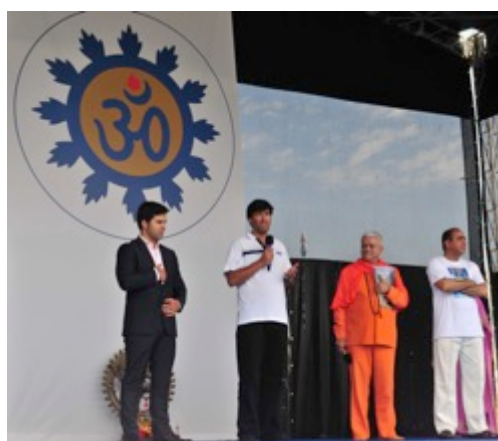
AS ENTIDADES OFICIAIS

A CÂMARA MUNICIPAL DE LISBOA foi a anfitriã desta Grande Comemoração, constituindo-se como um parceiro estruturante deste Projecto Global na sua qualidade de co-Organizador. Este Evento contou também com o apoio da SECRETARIA DE ESTADO DO DESPORTO E JUVENTUDE, do Plano Nacional para a Ética no Desporto, e da Fundação Pró-Dignitate, bem como de toda a Comunidade Hindu de Portugal, do Alto Comissariado para as Migrações, e da Associação para a Defesa dos Diabéticos de Portugal.