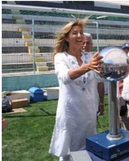
Macro Experiências de Física