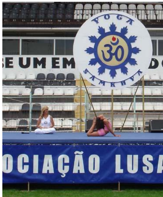
Sequência do Yoga para Crianças