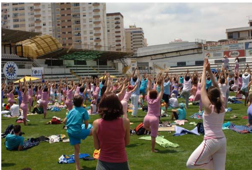
Mais de mil praticantes do Yoga no Estádio do Farense, dia 25 de Junho de 2006

DIA MUNDIAL do YOGA - Comemorado em 25 de Junho . Algarve . Faro Estádio S.Luis às 10 horas Informações: 289 813 136 e 217 802 810